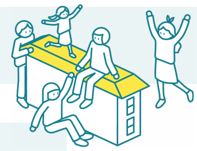
Cooperamos en soluciones de vivienda participativa