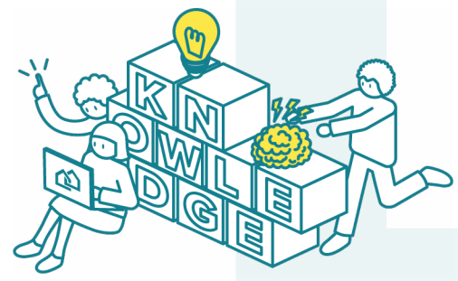
Colectivamente producimos conocimiento e información