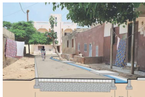
Fig 2. Coupe d'un pavage drainant sur une partie de la rue permettant évacuation des eaux, mobilité, et infiltration