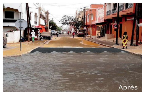
Fig 1. Simulations en 3D d'un arrêtoir d'eau au quartier Sentenac, commune de Wakhinane Nimzatt

L'ensemble de ces ouvrages est réalisé par les artisans locaux répertoriés et formés en école chantier, dans l'optique de pouvoir répliquer ces ouvrages et d'amoinrir les coûts de réalisation.