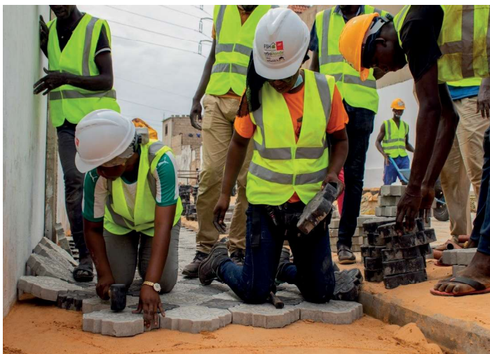
Ecole chantier de réalisation de pavage drainant