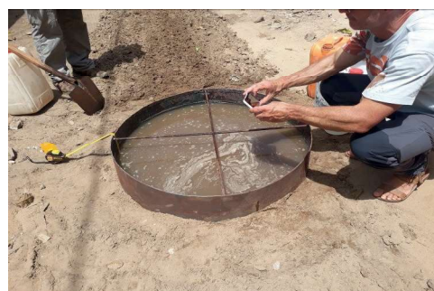
Fig 3. Test d'infiltration en surface après hersage